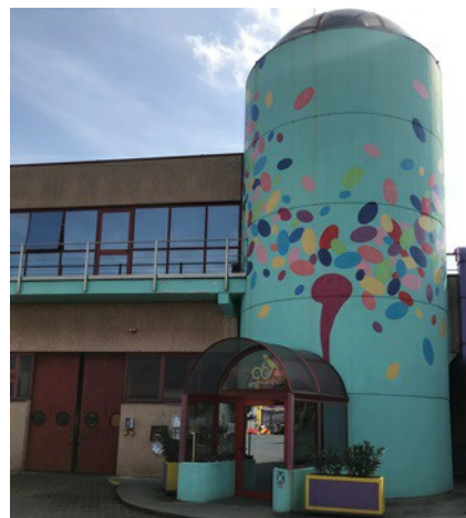
Sede de ACS Dobfar en Tribiano, cerca de Milán.