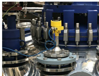
Hace más de diez años que los sensores de VEGA forman parte integral de la producción de ACS Dobfar.

La medición de la presión también cuenta con una fuerte representación en esta fábrica italiana, por ejemplo, en las líneas de alimentación de los productos terminados en los depósitos de almacenamiento. El VEGABAR 82 también se utiliza para controlar los procesos de producción y monitorizar el nitrógeno en la inertización. En algunos ámbitos del proceso, sobre todo cuando se usan sustancias altamente corrosivas, se utiliza el VEGABAR 82 con conexión a proceso de PVDF, juntas de FFKM y membranas cerámicas. Las aplicaciones abarcan desde mediciones en vacío a sobrepresiones de hasta 15 bares.