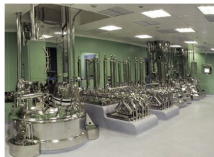
Los sensores de nivel controlan y regulan las cantidades de los productos más diversos.

En los depósitos de almacenamiento principales, que tienen una altura de 8 a 15 m y un diámetro de unos 2 a 3 m, hay instalados varios sensores de nivel de VEGA. Allí controlan y regulan las cantidades de los productos más diversos. Además de las materias primas, estos depósitos también almacenan disolventes y ácidos. «Imponemos varios requisitos simultáneos a los instrumentos. Sobre todo, los sensores instalados deben contar con la homologación ATEX. Recientemente, también hemos empezado a estandarizar nuestros instrumentos de medición de presión conforme SIL», explica Brucoli.