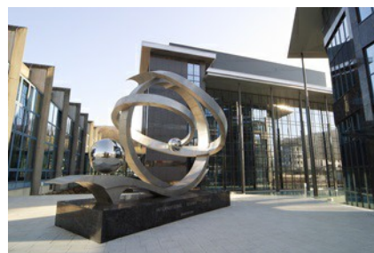
De hoofdvestiging van CARBOGEN AMCIS AG staat in Bubendorf, Zwitserland.

De vraag naar gepersonaliseerde geneesmiddelen en de eisen aan een volledig traceerbare kwaliteit stijgen. De benodigde innovaties worden vaak aangewakkerd door de kleinere, onderzoeksgerichte ondernemingen, die hun processen en goedkeuringsprocedures flexibel vormgeven en zowel arbeid als kosten door middel van standaardisering terugdringen. Bij CARBOGEN AMCIS AG gebruiken ze de VEGABAR Serie 80 . Want de druktransmitters voldoen dankzij hun grote meetbereik en de keramische CERTEC®-meetcel aan de eisen van de bioprocessen, van de fermentatie en filtratie tot en met de zuivering.