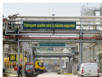
Le site de Croda Ibérica SA à Fogars de la Selva (Barcelone).

Le capteur de niveau VEGAPULS 64 lancé l'an dernier a également trouvé sa place sur le site et déploie tous ses atouts pour mesurer un assortiment de formules nettoyantes spéciales et d'alcools. Les appareils mesurent le niveau de matière première dans trois cuves de deux, trois et cinq mètres de haut respectivement. Le résultat des mesures est capital pour la suite du process, car le produit final dérivé de cette matière première compte pour un quart de la production totale de l'usine. Comme le capteur de niveau VEGAPULS 64 utilise la technologie radar de mesure sans contact, il pose intrinsèquement moins de problèmes de colmatages . Du point de vue de l'hygiène également, la mesure radar est idéale. Ainsi, l'antenne encapsulée arasante est optimale à nettoyer et insensible aux conditions extrêmes des processus de SEP et NEP.