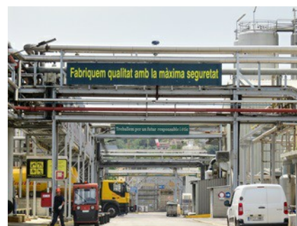
Gli stabilimenti della Croda Ibérica SA presso la sede di Fogars de la Selva (Barcellona).

Croda Ibérica è pertanto grata di ogni procedimento e di ogni punto di misura che funziona in maniera affidabile nel corso di molti anni. L'azienda collabora con VEGA Spagna da oltre dieci anni. Nello stabilimento sono installati circa 200 sensori di diverse famiglie di prodotti, tra cui trasduttori di pressione , sensori radar ad onda guidata , diversi rilevatori di soglia di livello per liquidi e solidi, nonché trasduttori di pressione differenziale .