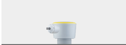
VEGAPULS C 22