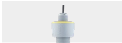
VEGAPULS C 11