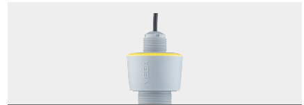
VEGAPULS C 21