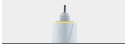
VEGAPULS C 23