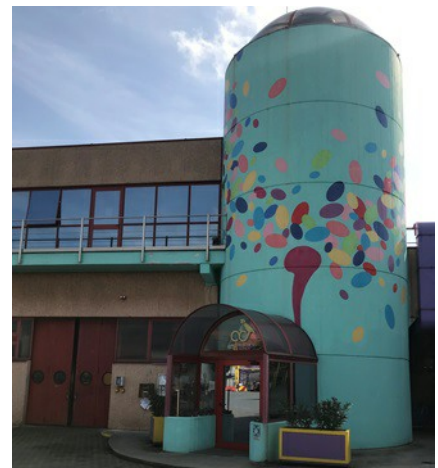
Hauptsitz von ACS Dobfar in Tribiano bei Mailand.