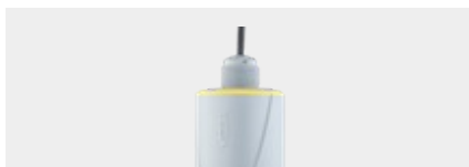
VEGAPULS C 23