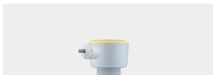
VEGAPULS C 22