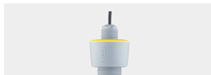
VEGAPULS C 21