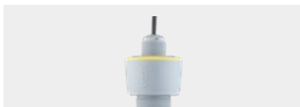
VEGAPULS C 11