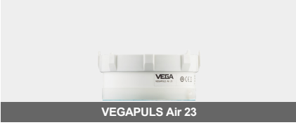
VEGAPULS Air 23