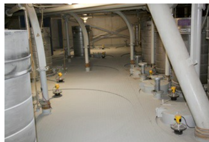
Chaque silo dispose désormais d'un VEGAPULS 69 qui remplace le pesage.

Presque tous les capteurs ont fonctionné avec fiabilité et fourni des valeurs précises dès le début. Comme les appareils VEGA affichent un niveau de remplissage en pourcentage, un programme convertit ces mesures en tonnages. La gestion des stocks assure une sécurité supplémentaire. Seul le silo contenant des matières premières à faible densité apparente a présenté quelques difficultés. Ces produits sont compliqués à mesurer, et jusqu'à présent aucun capteur ne fonctionnait correctement. Par exemple, les joints du silo généraient des échos parasites. Les courbes écho du silo vide sont déjà très complexes.