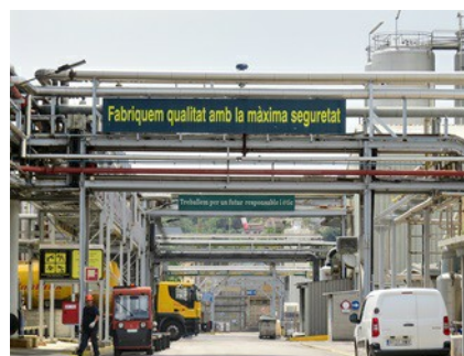
Le site de Croda Ibérica SA à Fogars de la Selva (Barcelone).

Le capteur de niveau VEGAPULS 64 lancé l'an dernier a également trouvé sa place sur le site et déploie tous ses atouts pour mesurer un assortiment de formules nettoyantes spéciales et d'alcools. Les appareils mesurent le niveau de matière première dans trois cuves de deux, trois et cinq mètres de haut respectivement. Le résultat des mesures est capital pour la suite du process, car le produit final dérivé de cette matière première compte pour un quart de la production totale de l'usine. Comme le capteur de niveau VEGAPULS 64 utilise la technologie radar de mesure sans contact, il pose intrinsèquement moins de problèmes de colmatages . Du point de vue de l'hygiène également, la mesure radar est idéale. Ainsi, l'antenne encapsulée arasante est optimale à nettoyer et insensible aux conditions extrêmes des processus de SEP et NEP.