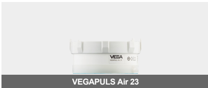
VEGAPULS Air 23