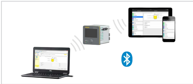
Conexão sem fio com smartphones/tabletes/notebooks

A configuração ocorre através de um app gratuito do "Apple App Store", do "Google Play Store" ou do "Baidu Store". Como alternativa, a configuração pode ser realizada através de PACTware/DTM e um PC com Windows.